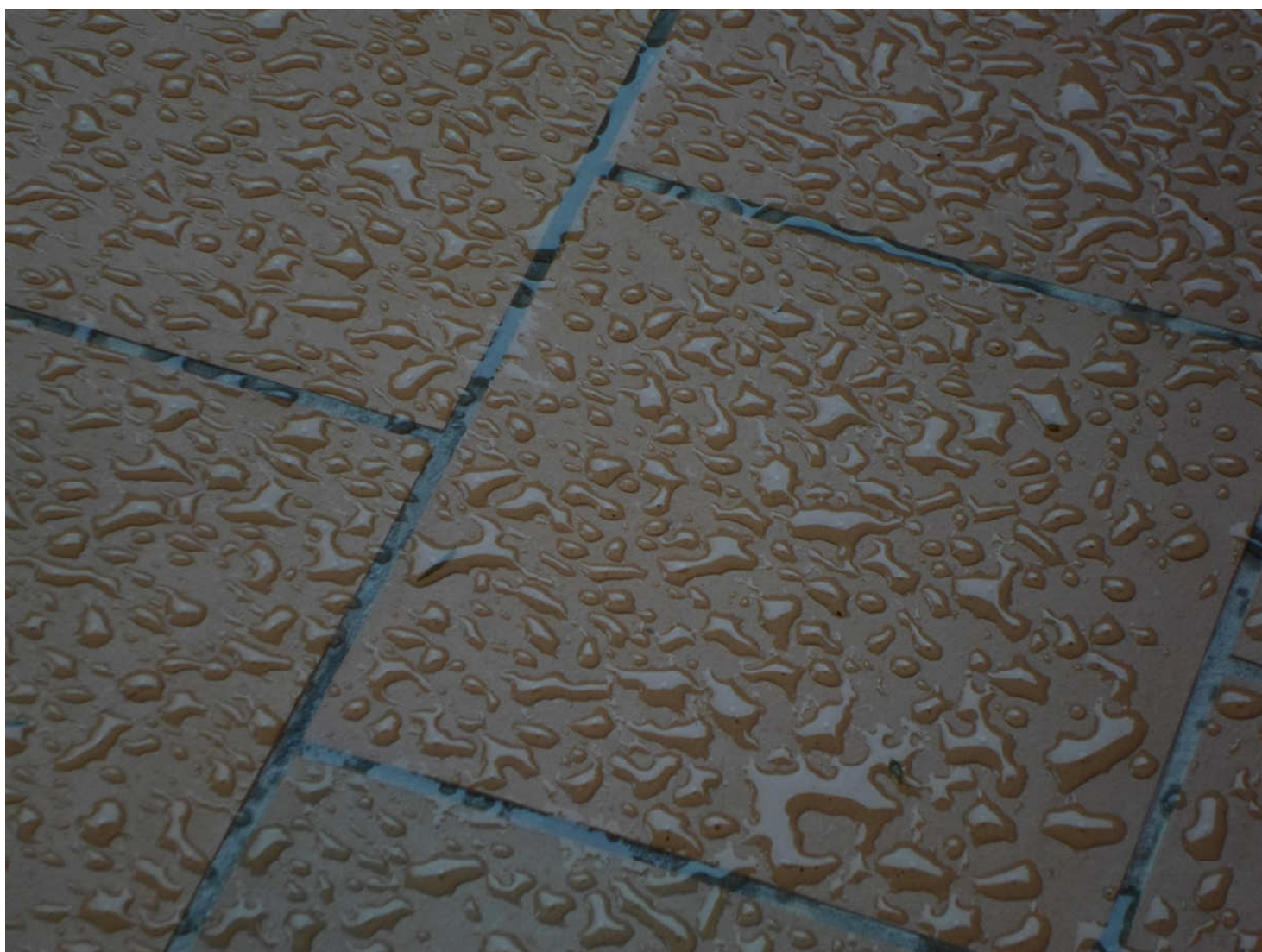
Παράδειγμα εφαρμογής σε cotto.